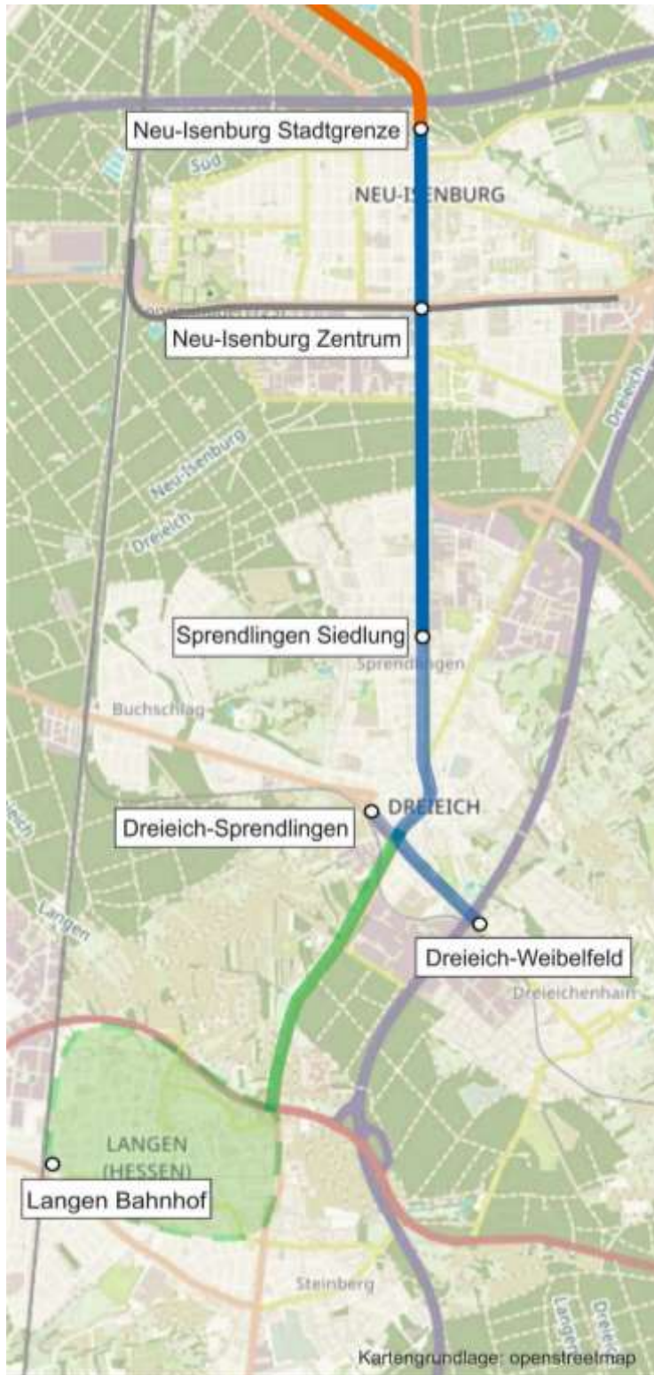
Grafik: Straßenbahn Frankfurt – Neu-Isenburg – Dreieich – Langen (mit Varianten). Copyright traffiQ